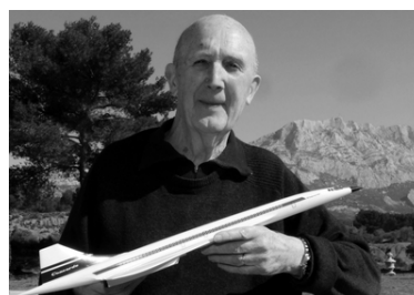
André TURCAT et les équipages d'Air France portent aujourd'hui à eux seuls la fierté d'avoir vécu cette véritable aventure et d'être les derniers pionniers de l'aviation

Avec les collègues qui ont travaillé sur le Concorde, nous pouvons être fiers d'avoir participé à « une cathédrale du XX ème siècle ». C'est le terme employé par un ancien pilote de Concorde d'Air France lors de son exposé à Verneuil.