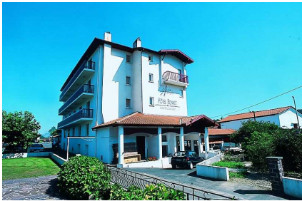
BIENVENUE AU PAYS BASQUE