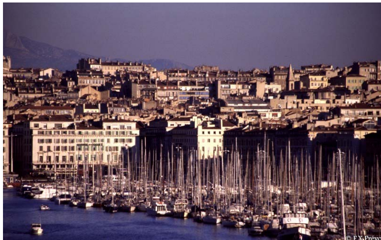
Vieux port de Marseille

Apéritif tous ensemble. Dîner et nuit à bord de votre bateau.