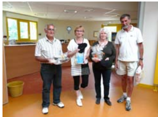
Les gagnants 2012

Le lundi 17 juin 2013 au boulodrome des Mureaux Rue Hubert Mouchel (près de la piscine) à 9 heures