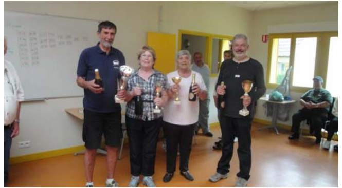
Les gagnants 2013