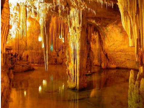
Les Grottes de Castellana

Petit-déjeuner à l'hôtel puis visite des grottes de Castellana, creusées par les rivières souterraines, ce sont les plus importantes de toute l'Italie. Nous ferons un parcours d'environ 50 minutes à la découverte d'une partie de ce bel ensemble souterrain. Route dans la région des Trulli, ces maisons dont les murs et la pierre de façade sont peints à la chaux et dont le toit est couvert de pierres plates. Déjeuner typique dans une Masseria et visite de la ville d'Alberobello qui possède un important quartier de Trulli. Visite du Trullo Sovrano : C'est le plus grand trullo d'Alberobello : il est à deux étages et ne comporte pas moins de douze cônes... Les quelques meubles qu'il conserve permettent d'imaginer l'affectation des différentes pièces. Retour à l'hôtel à Selva Di Fasano. Dîner et nuit.