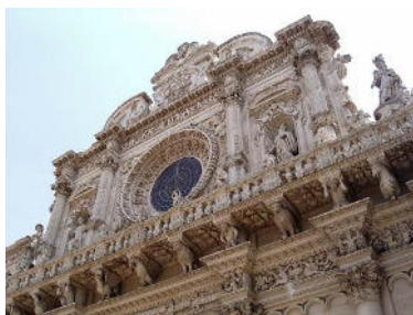
Basilique Santa Croce de Lecce

8 ème JOUR LECCE - POLIGNANO - BARI - PARIS