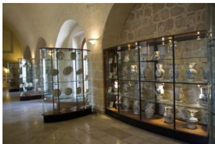
Musée des Céramiques de Grottaglie