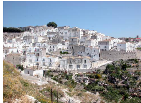
Monte San Angelo

Petit-déjeuner. Le matin, route vers Bitonto, ville ancienne qui possède une belle cathédrale du type de celle de Trani ou Bari. Visite intérieure de la cathédrale. Route vers Bari, déjeuner et visite du chef-lieu de la région. On verra entre autres ; le centre historique et la basilique Saint Nicolas au cœur de la vieille ville. C'est l'un des exemples les plus remarquables de l'art roman des Pouilles, puis le Castello (vue extérieure), élevé en 1233 sur des édifices byzantins et normands, enfin les ports avec le grand port et le vieux port. En fin d'après-midi route vers le sud.